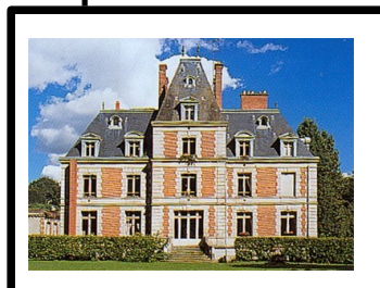
Domaine des pastoureux