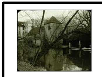
Moulin des scellés