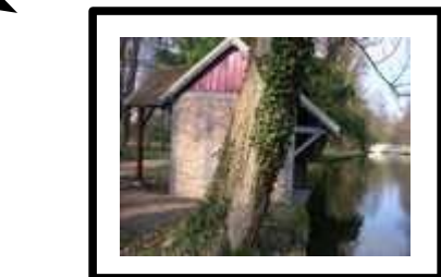
Lavoirs du parc