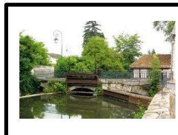
Pont de Goujon